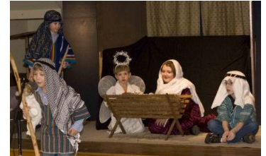
Niños dan su representación Navideña en el nuevo santuario de Evergreen

Habiendo dicho esto, se toma un poco de tiempo para adaptarnos y sentirnos "en casa." Todavía desempacamos y empacamos la mayoría de nuestras cosas cada semana. Estamos llegando a conocer a nuestra congregación anfitriona, aprendiendo cada una acerca del ministerio de la otra, y aprendiendo cómo compartir un edificio. Hemos podido ayudar en algunas mejoras del edificio y estamos animados de la posibilidad de hacer alcance local juntos.