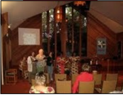
Grupo de Mujeres comparte un canto