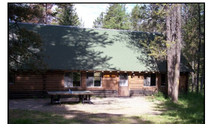
Pabellón en Palisades Camp

Nosotros Alabamos a Dios en adoración Guiamos a personas a fe en Jesús Edificamos el carácter cristiano Ofrecemos amistad y apoyo cristiano Servimos a otros en amor.