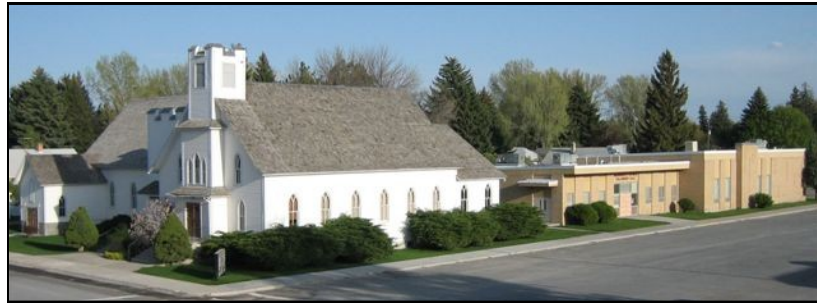
Edificio de la iglesia y salón de compañerismo de First Mennonite

Desde el nacimiento de la iglesia en 1907, la iglesia ha tenido muchos ministerios significativos. Uno de los ministerios continuos de la iglesia desde 1958 ha sido el de campamentos. La iglesia, desde 1958, opera un programa de campamento bíblico de verano para Jóvenes Menores, grados 4-7,