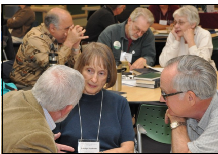
Participantes moran juntos en la Palabra

A comienzos de Agosto, paquetes de Morar en la Palabra se enviarán a cada pastor, capellán y director espiritual en nuestra conferencia. El paquete se compartirá también a través de nuestro e-Boletín y página cibernética para que todos puedan