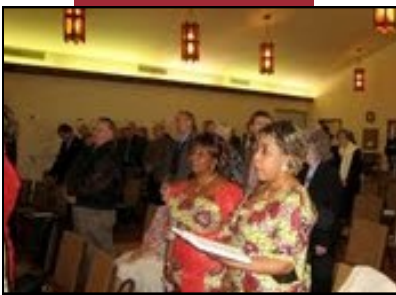
Servicio de adoración de clausura