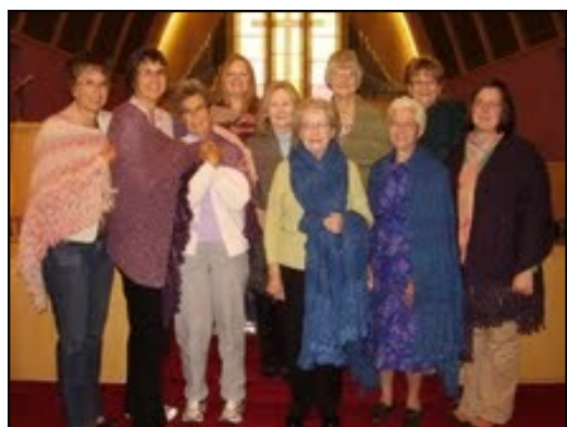
Se entregaron Chales de Oración en Cuidado de Hermanas en WA. Cada grupo decidió quién en su mesa recibiría el regalo preparado por las Mujeres de Mountain View Mennonite, Kalispell.